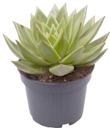
Echev Pluto Galaxy D12H20 1100 ₺