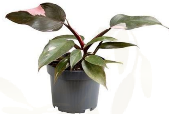
Филодендрон Pink Princess D12H25 8380 ₽