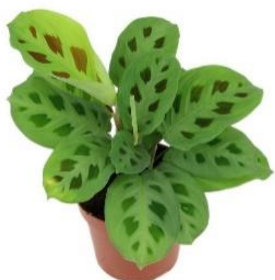
Маранта Керховена D12H25 1710 ₽