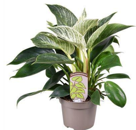
Филодендрон Биркин D12H35 2740 ₽