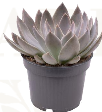
Echev Silver Shine D12H20 950 ₺