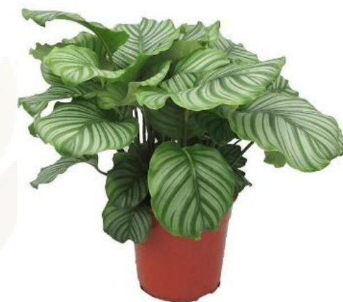
Калатея Орбифолия D12H45 2800 ₺