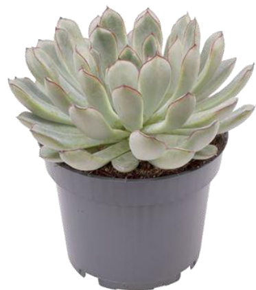
Echev Pulidonis D12H20 1139 ₺