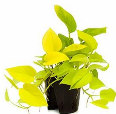
Сциндапусс Голден Потос D12H25 2830 ₽