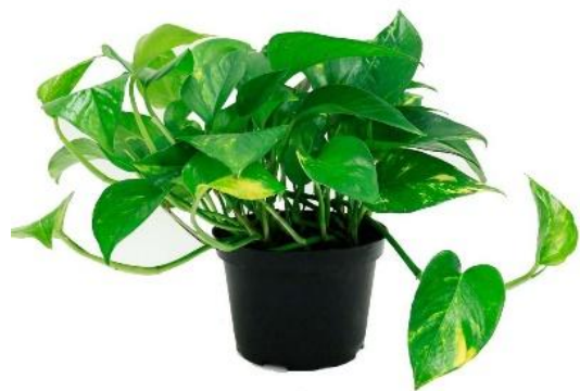
Эпипремнум Ауреум D12H25 1450 ₽