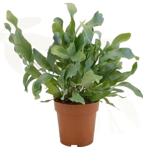
Флебодиум Блю Стар D12H40 1850 ₽