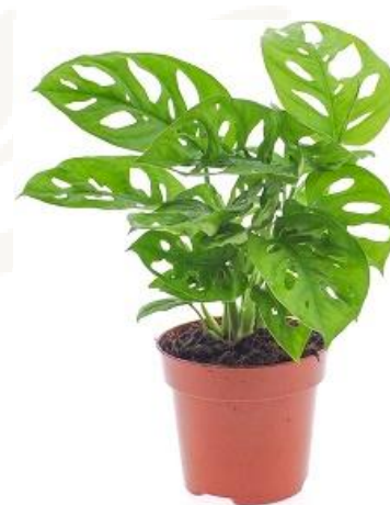
Монстера Обликва 1900 ₺