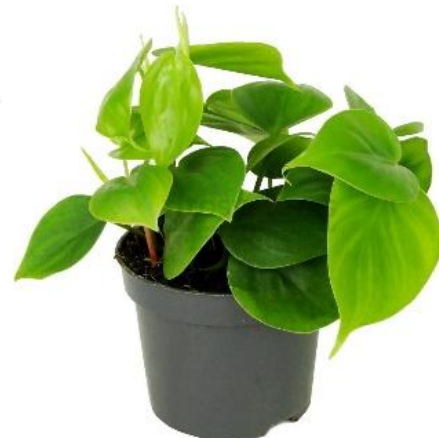
Филодендрон D12H20 1600 ₽