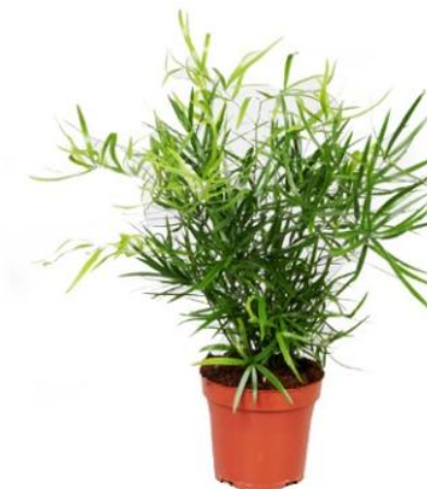
Аспарагус D12H35 1740 ₽