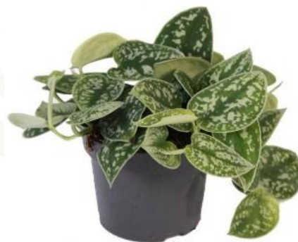
Сциндапусс Треби D12H25 1530 ₽