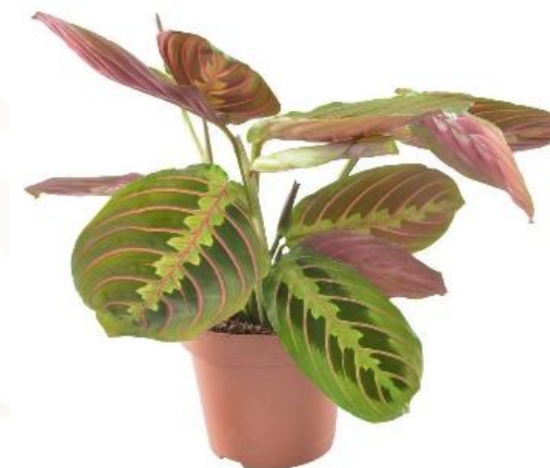
Маранта D12H25 1680 ₽