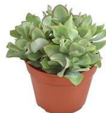
Crass Arbor Undilati D12H15 2100 ₺