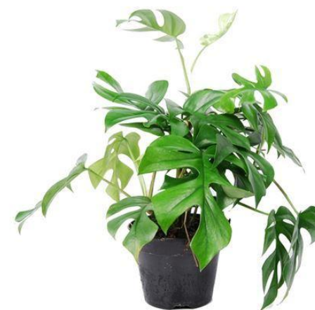
Рододендрон D12H25 2960 ₽