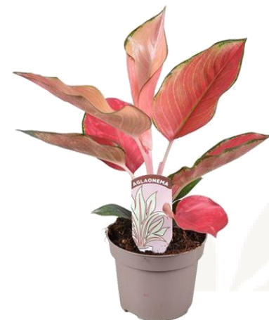
Аглаонема Пинк Даймонд 4550 ₺