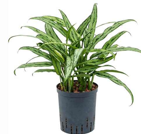
Аглаонема Кутласс D12H30 1780 ₽