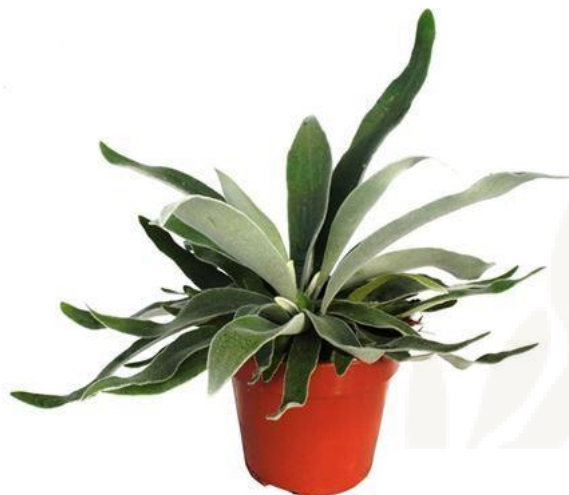
Платицериум Браам D12H45 3870 ₽