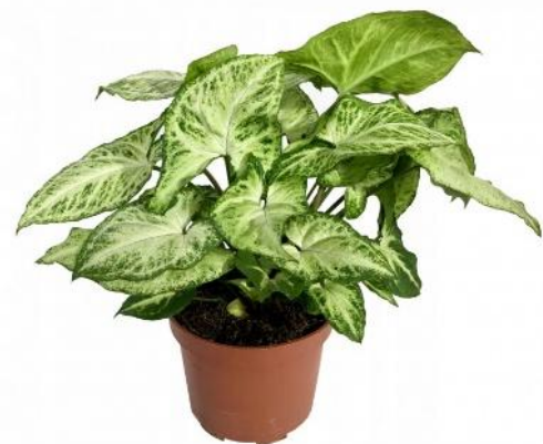
Сингониум D12H25 1530 ₽