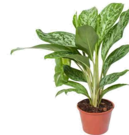
Аглаонема Страйпс D12H40 3350 ₽