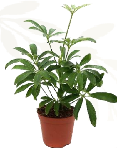
Шеффлера D12H35 1970 ₽