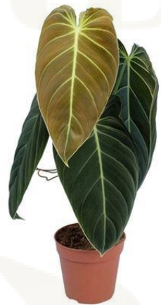
Филодендрон Melanochryum D12H35 9240 ₽