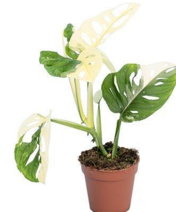
Monstera Adansonii Variegata D12H35 172 125 ₽