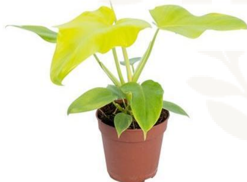
Филодендрон Голден Виолин D12H35 3690 ₽