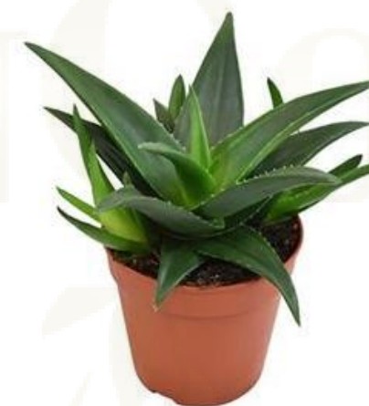
Haworthia P Wes Jogo D12H15 1990 ₺