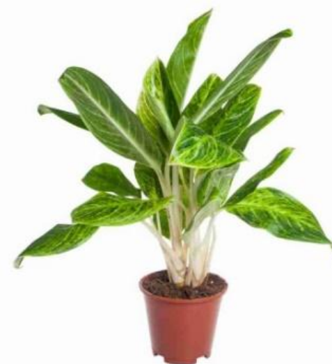
Аглаонема Кей Лайм D12H45 2810 ₽