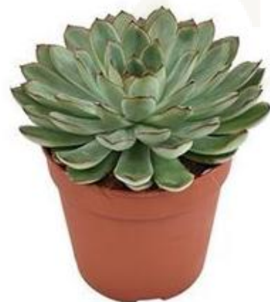
Echev Pulidonis Pelicuda D12H20 860 ₺