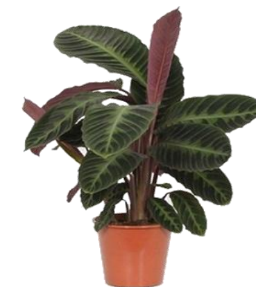
Калатея Варшевича D12H45 2950 ₺