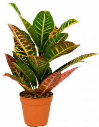
Кротон D12H35 1980 ₽