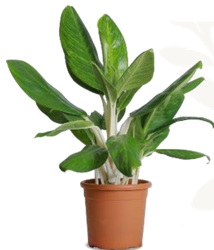
Аглаонема Кинг оф Сиам D12H40 3500 ₽