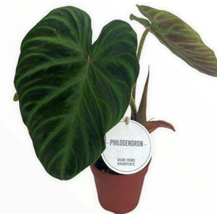
Филодендрон Verrucosum D12H35 5950 ₽