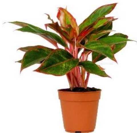
Аглаонема Крете 4120 ₺