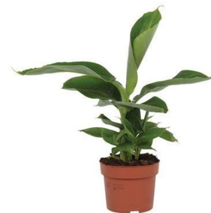
Банан Муса D12H35 2580 ₺