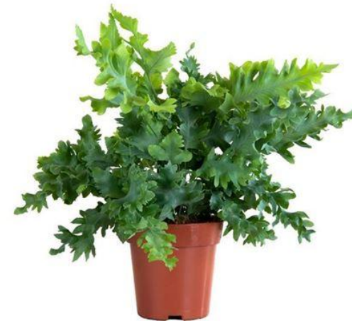
Флебодиум Даванна D12H20 1780 ₽