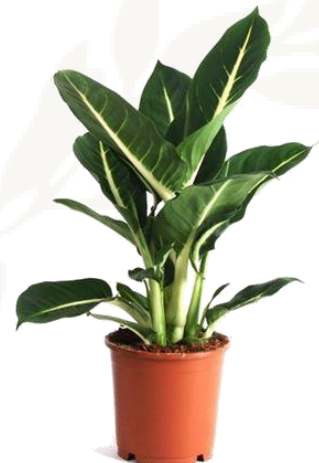
Диффенбахия D12H35 1770 ₽