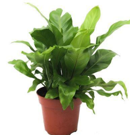
Асплениум D12H25 1470 ₽