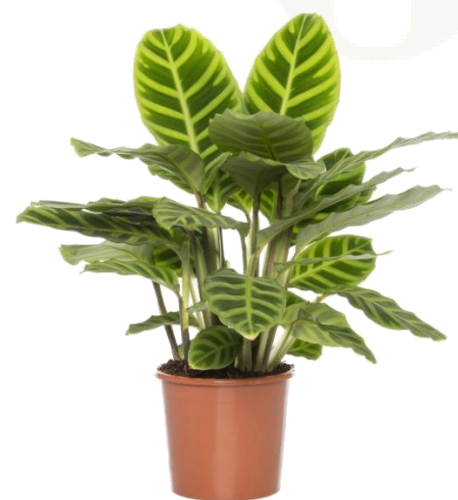
Калатея Зебрина D12H40 2780 ₺