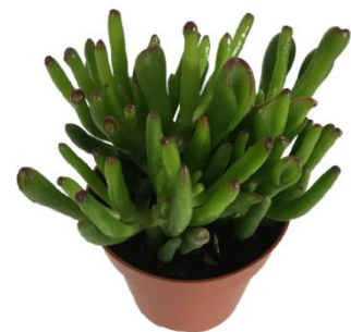
Crass Gollum D12H20 2240 ₺