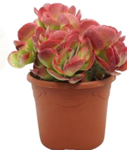
Kalan Th Red Lips D25H20 8190 ₺