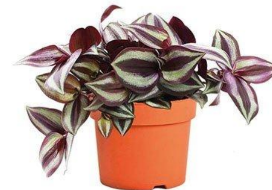
Традесканция D12H25 1430 ₽