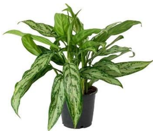
Аглаонема Мария D12H35 2250 ₽