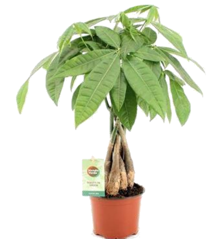
Пахира D12H35 3090 ₽