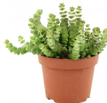
Crass Marnieriana D12H15 2100 ₺