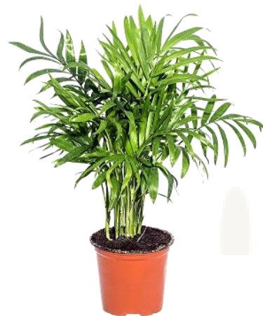
Хамедорея D12H45 1850 ₽