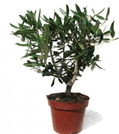
Олива D12H35 3980 ₺