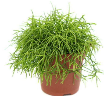
Рипсалис D12H15 1990 ₺