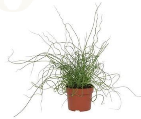
Джункус Спиральный D12H35 2120 ₽