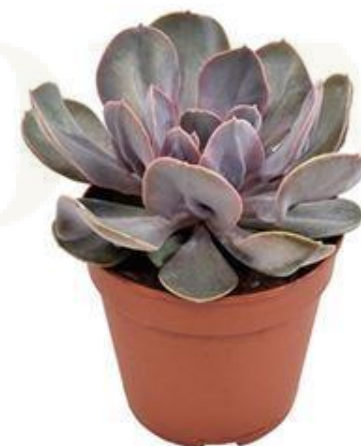
Echev Trompette D12H20 780 ₺