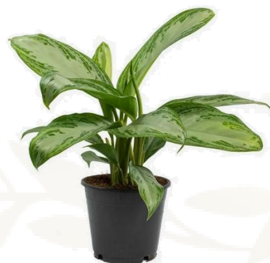
Аглаонема Сильвер Бей D12H35 1930 ₽