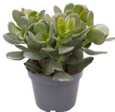
Crass Ovata D12H20 1820 ₺