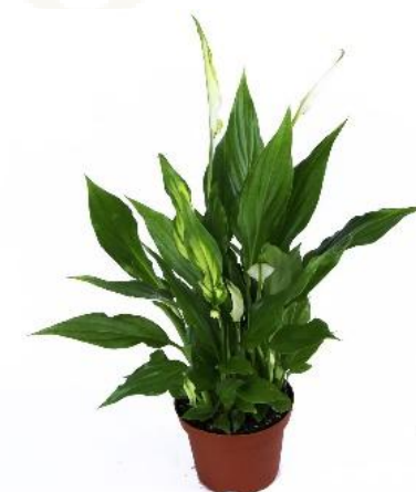
Спатифиллум Алана D12H40 1310 ₽