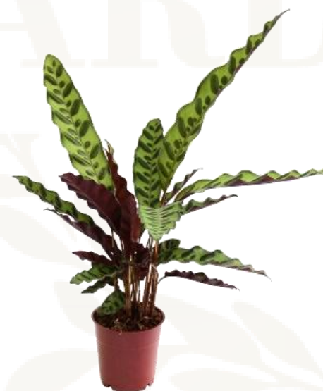
Калатея Лансифолия D12H45 2470 ₺