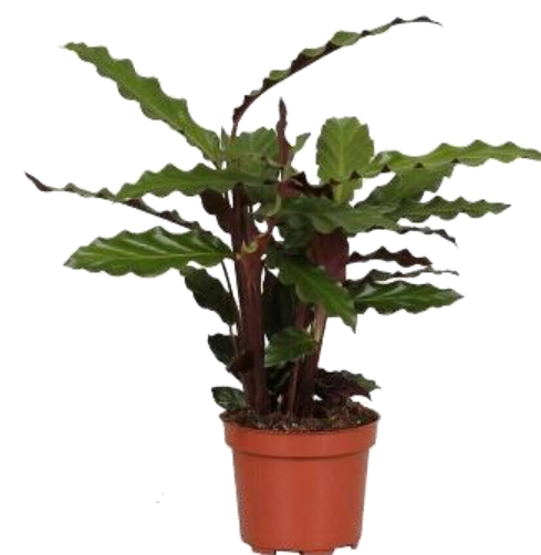
Калатея Тропистар D12H35 1910 ₺