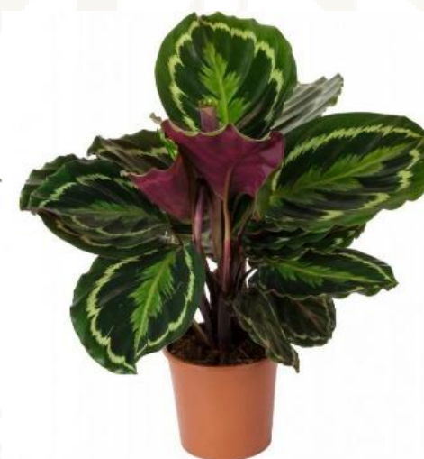
Калатея Медальон D12H35 4130 ₺