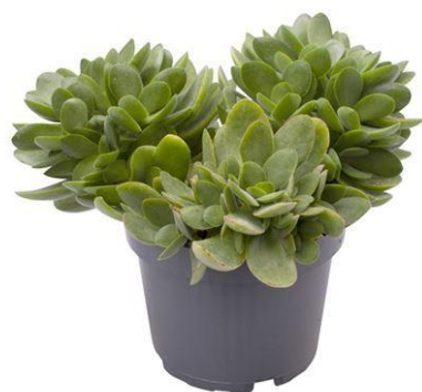
Crass Moneymaker D12H15 2680 ₺