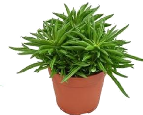
Pep Happy Bean D12H20 1780 ₺