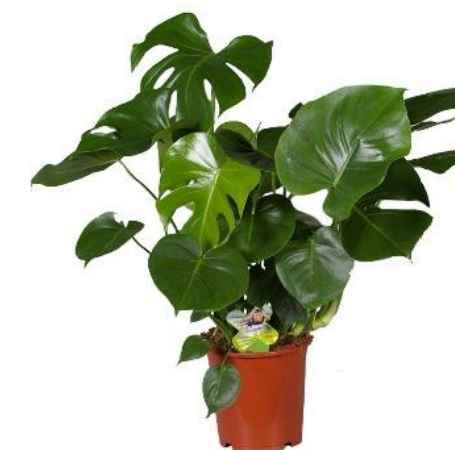
Монстера Деликатесная D15H45 2960 ₽