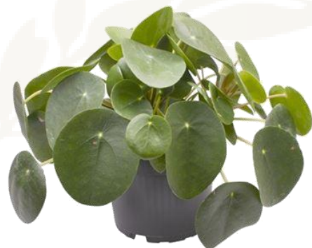
Пилея Ререромиоидес D12H30 2380 ₽