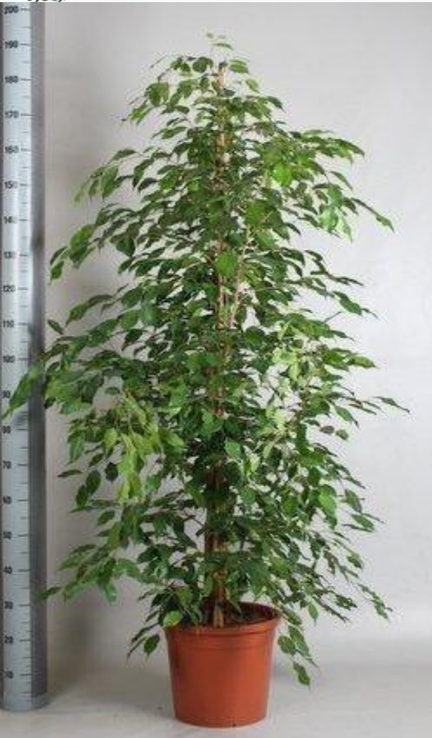
ФИКУС БЕНДЖАМИНА Высота 190 см. Ширина 60 см. Горшок 30 см.