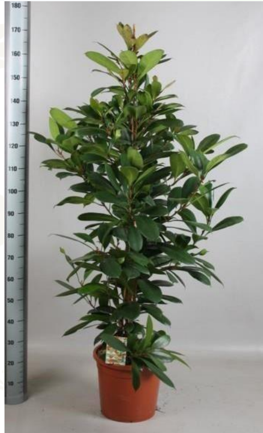
ФИКУС ЦИАПУСТИЛА Высота 180 см. Ширина 60 см. Горшок 30 см.